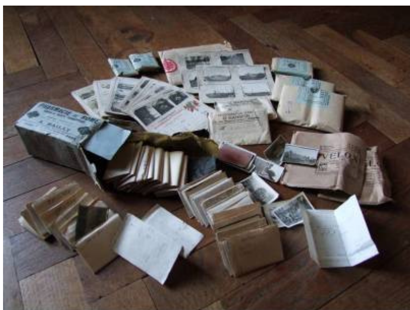
Etat du fonds photographique Jacques Tournadour d'Albay avant traitement archivistique

Après la Grande Guerre, Jacques Tournadour d'Albay procède à la mise en ordre de ses photographies. Numérotés de 1 à 597, les négatifs bénéficient d'un conditionnement en pochettes cristal tandis que les tirages sont disposés de manière insolite sur des albums de fortune, plus précisément des cartes de correspondance militaire et des carnets. 126 cartes, méticuleusement numérotées de 1 à 126, nous sont ainsi parvenues, sur lesquelles sont insérées les photos 101 à 478. Pendant le conflit, les autorités militaires avaient mis à disposition du soldat un grand nombre de cartes, tant pour sa correspondance avec l'intérieur qu'avec l'arrière. A partir de la photographie n°479, Jacques Tournadour d'Albay choisit de disposer ses tirages, quatre sur chaque page, dans deux carnets manuscrits (18 x 12 cm). En marge des photographies dûment légendées, il convient de relever la présence de 230 négatifs en pochettes, non numérotés. Certains complètent des reportages légendés en albums (un Fokker abattu en avril 1916, un concours de cuisiniers en septembre de la même année) tandis que la plupart des autres (portraits de famille, portraits d'officiers, paysages dévastés, etc.) restent encore à identifier.