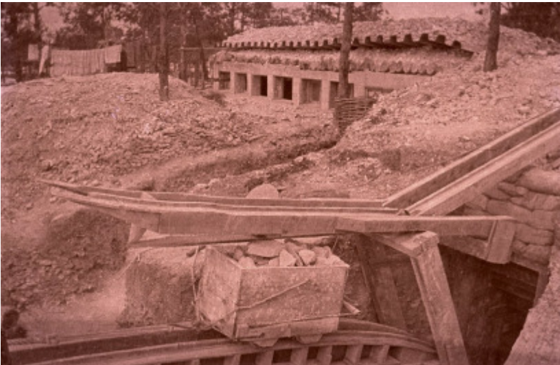
Référence : D171-1-563 Le wagonnet soulève l'aiguillage modèle.