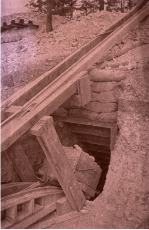
Référence : D171-1-561 Le wagonnet franchit la courbe.