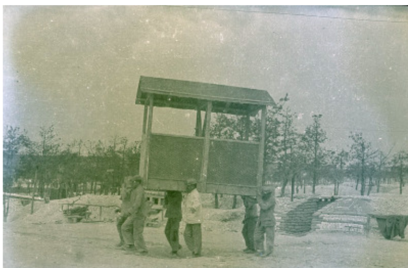
Référence : D171-1-451 Juin 1916. Le transport des WC.