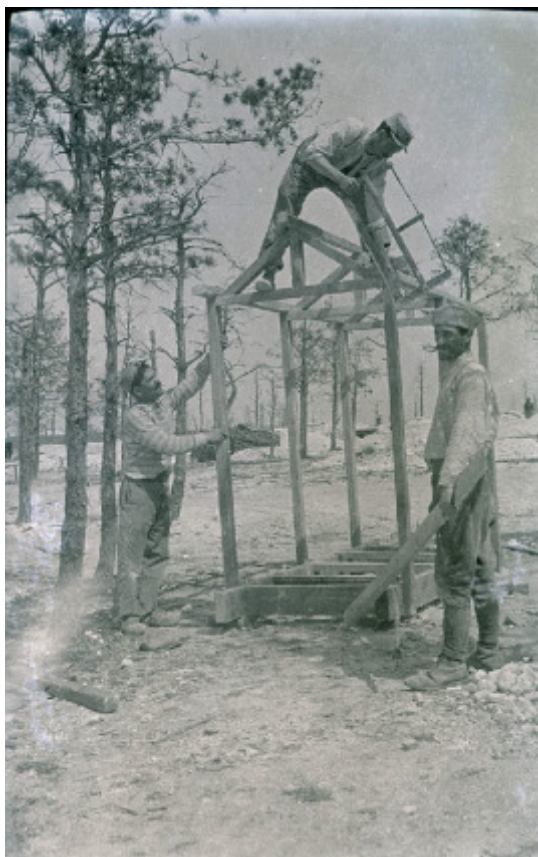
Référence : D171-1-430 Camp A. Mai 1916. Construction d'un WC.