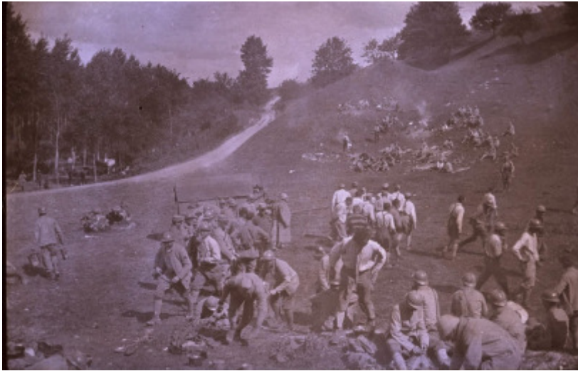
Référence : D171-1-544 Quiry-le-Sec. 1-9-16.