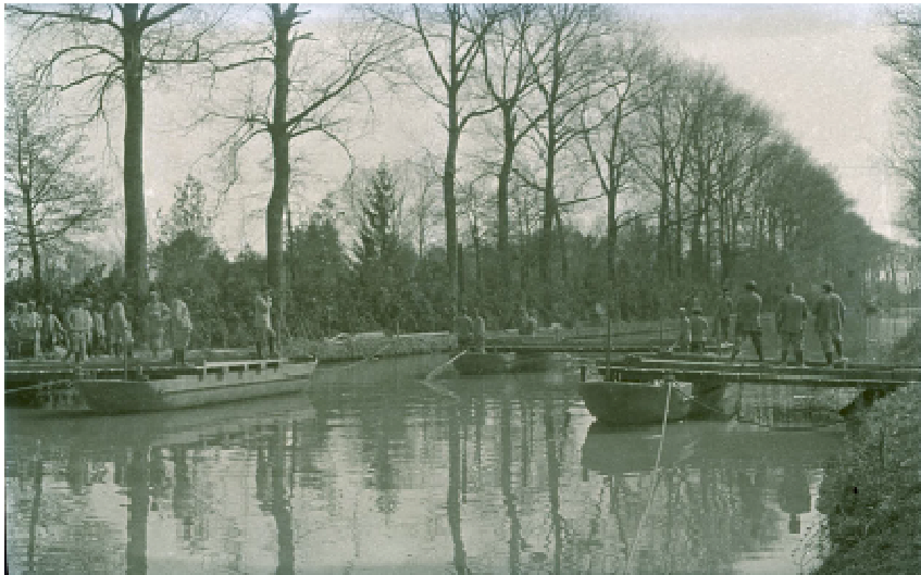
Référence : D171-1-337 On amène la portière sur le pont. 4-16.