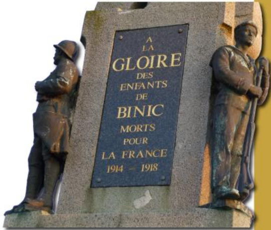
Le monument aux morts de Binic (Côtes d'Armor)

Pars à la découverte des poilus de ta commune. Comme un historien, élabore ta documentation en te référant aux archives. Analyse les données collectées et explore l'histoire de la Grande Guerre!