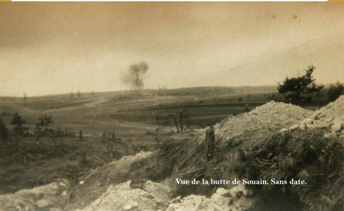
Vue de la butte de Souain. Sans date.

- En allant sur des sites de géolocalisation tels que Google Earth ou le Géoportail , tu pourras découvrir les endroits précis où combattent les poilus de ta commune , en te fiant aux indications des journaux des marches et opérations.