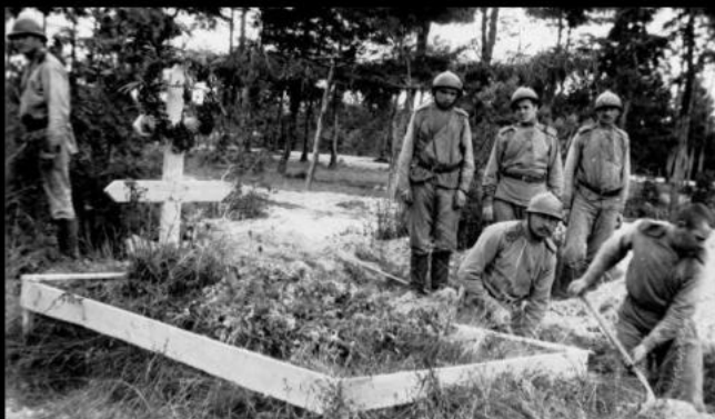
Soldats embarquant pour le front. Photographie datée de décembre 1914.

non seulement les premières semaines de la guerre sont les plus meurtrières du conflit mais le sort de nombreux combattants demeure inconnu : on ne sait si ils sont blessés, prisonniers... ou tués. La mission de ce service est donc d'obtenir des informations précises et de les transmettre aux familles concernées. Son travail est considérable puisqu'au final, 1 400 000 poilus sont répertoriés.