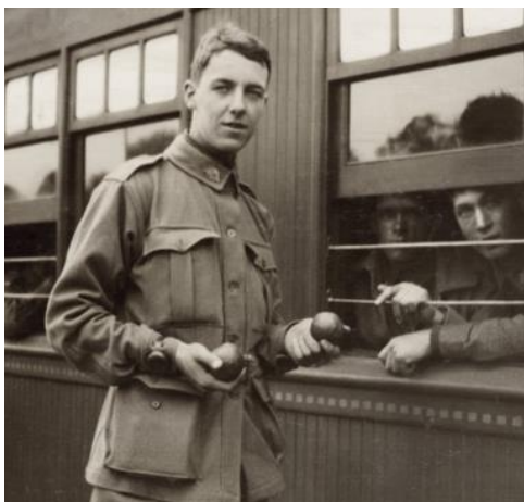
Le capitaine Thomas Richard Richmond Baker

vis de la "Mère patrie", par loyauté ethnique et familiale ou pour découvrir le monde lors des permissions. 416819 Australiens se sont portés volontaires pour l'Australian Imperial Force (AIF). Parmi eux, 331.000 ont servi à l'étranger. Plus de 60.000 seront tués et plus de 159.000 blessés, gazés ou faits prisonniers.