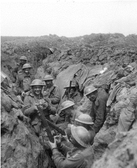
Des australiens dans une des tranchées reprises à Bullecourt en mai 1917