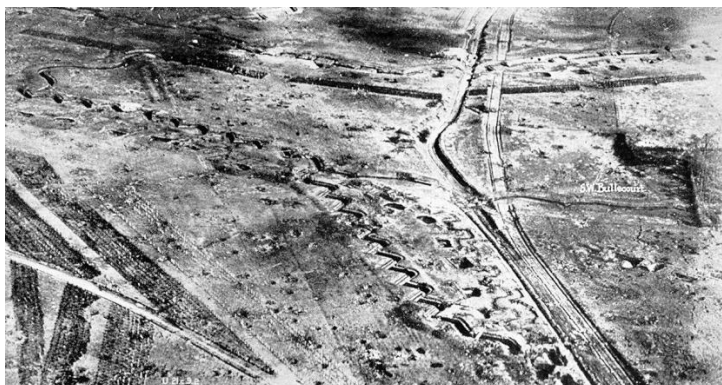
La ligne Hindenburg dans le secteur de Bullecourt.