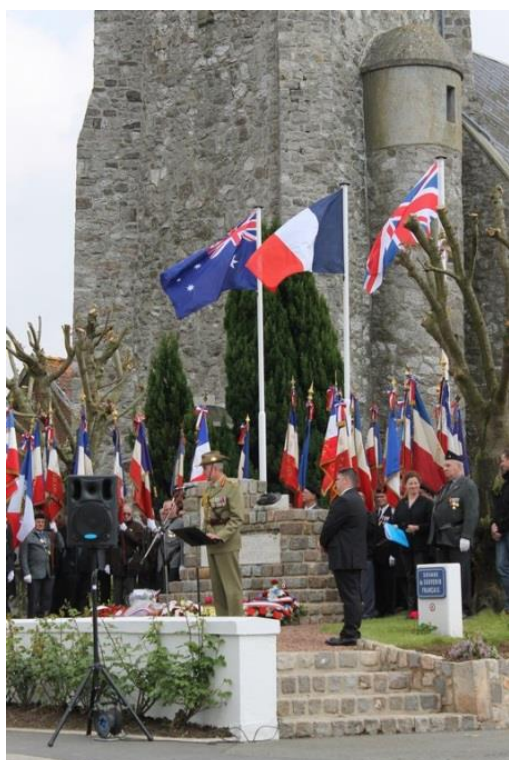
Visuel n°2 : Parc mémorial du Digger