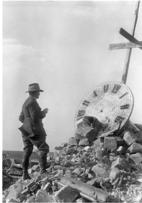
Un aumônier australien devant les ruines de l'église de Vaux-Vraucourt