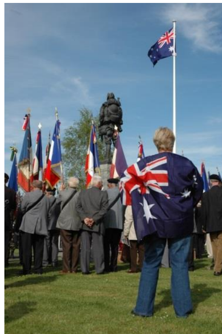
Cérémonie, parc mémorial du Digger, Bullecourt.

La cérémonie française sera suivie de la commémoration australienne du centenaire des batailles de Bullecourt, à 15h au mémorial australien du Digger, situé rue des Australiens.