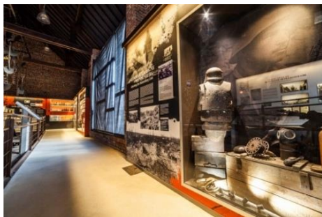
Musée Jean et Denise Letaille

T out au long de leur vie, Jean et Denise Letaille, un couple d'agriculteurs de Bullecourt, ont rassemblé une impressionnante collection d'objets trouvés dans leurs champs et dans la campagne alentour. Des armes, mais aussi des rasoirs, des peignes, des étuis de cigarettes et d'autres effets personnels venus d'Australie, d'Allemagne et du Royaume-Uni, ont été retrouvés sur l'ancienne ligne de front au côté des hommes à qui ils appartenaient, tombés durant les deux batailles de Bullecourt