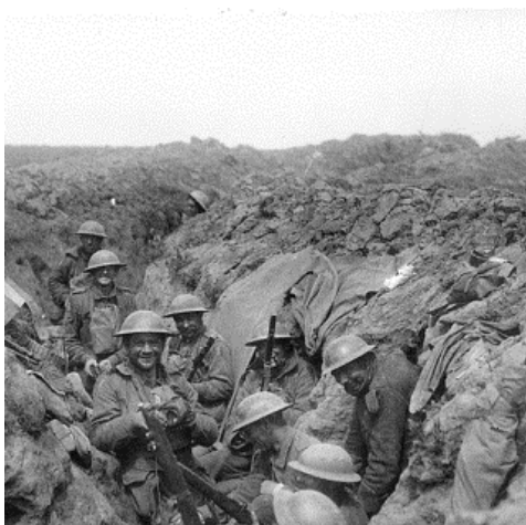
Des Australiens se préparent pour une contre-attaque allemande et nettoient leurs fusils dans une des tranchées reprises à Bullecourt en mai 1917. E00454

Des clichés pris par les photographes officiels australiens mettent en évidence la présence de leurs troupes au Sud d'Arras, durant l'année 1917. Ces hommes positionnés à l'arrière ou dans