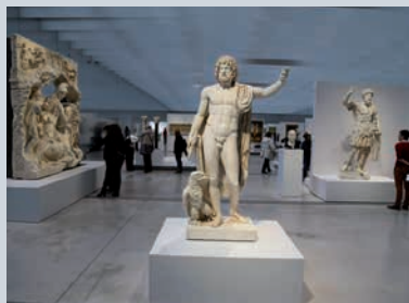
La Galerie du Temps