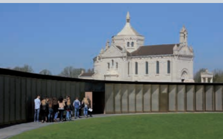
L'Anneau de la Mémoire et la chapelle de Notre-Dame- de-Lorette à Ablain-Saint-Nazaire