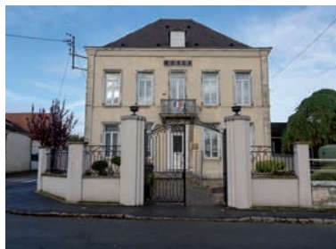
Le Musée d'Histoire et d'Archéologie de Harnes

Exposition « Une guerre sans clichés » présentée à Lens