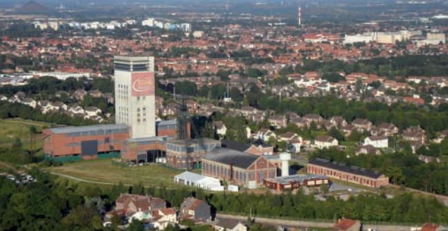
La Base 11/19 à Loos-en-Gohelle