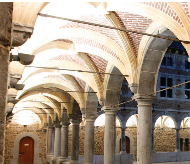
Le Musée de la Vie Wallonne à Liège ( 1000 m 2 )