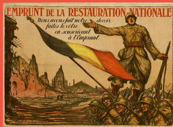
Coll. Musée de la Vie wallonne Province de Liège, arch. N° 2027305

L'exposition souligne l'importance de cette valeur fondamentale qu'est la paix, garante de la démocratie, de la liberté, de la justice et de la solidarité. Elle s'adresse particulièrement aux jeunes générations par le biais d'un parcours enfants et d'un dossier pédagogique.