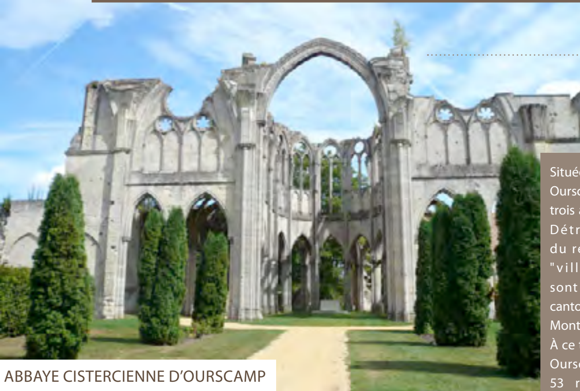
ABBAYE CISTERCIENNE D'OURSCAMP

Située sur la Route de Paris, Chiry-Ourscamp demeura pendant près de trois années le dernier village allemand. Détruit presque totalement lors du repli ennemi de mars 1917, ce "village-martyr" où les obus se sont abattus par rafales, connut les cantonnements alliés, la Bataille du Mont-Renaud puis la retraite allemande. À ce titre, La Kommandantur de Chiry-Ourscamp, détruite en 1918, se situait 53 rue Royale. Dans cette maison fortifiée, les ordres militaires et civils étaient donnés pour le secteur entier.