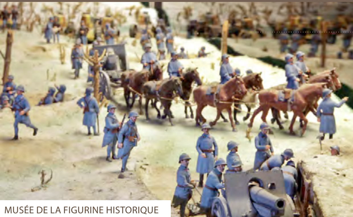
MUSÉE DE LA FIGURINE HISTORIQUE