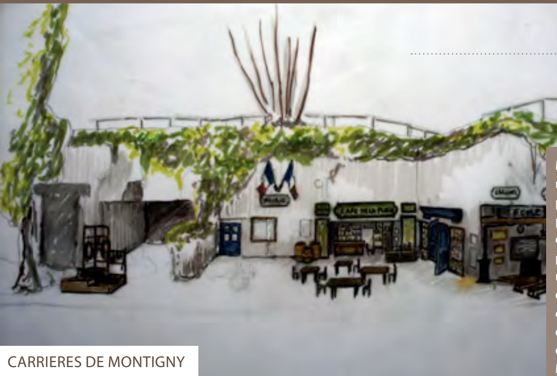
CARRIÈRES DE MONTIGNY

Manifestations, animations, hommage, expositions, spectacles pédagogiques, reconstitutions, projections : à l'occasion du centenaire 14-18, l'Oise est sur le pied de guerre pour commémorer ces 4 années de conflit mondial avec une programmation culturelle et événementielle variée, destinée à tous les publics. Un village de 1914 ressuscité à l'identique à Machemont et une exposition singulière sur les poilus artistes à Noyon inaugurent ce cycle mémoriel.