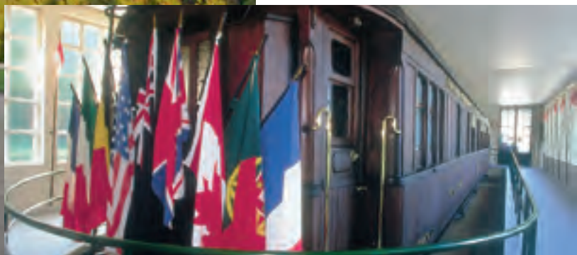
LA CLAIRIÈRE DE L'ARMISTICE À RETHONDES