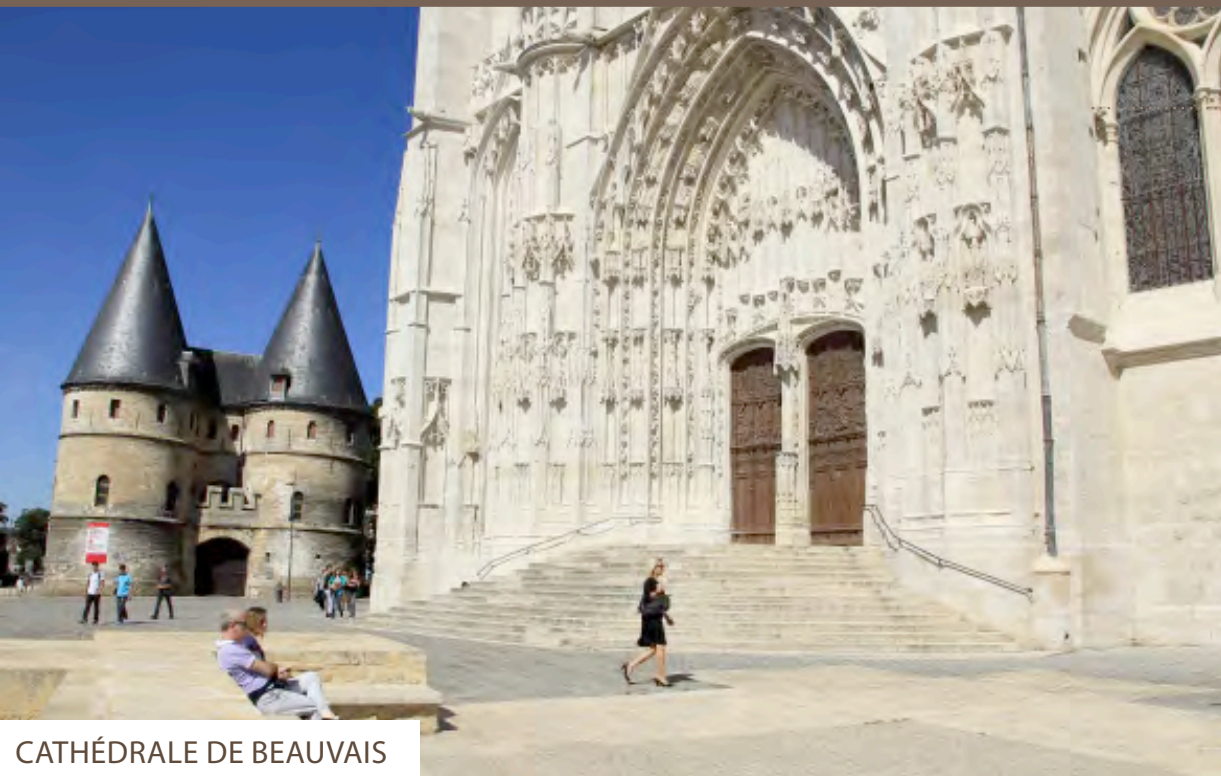
CATHÉDRALE DE BEAUVAIS