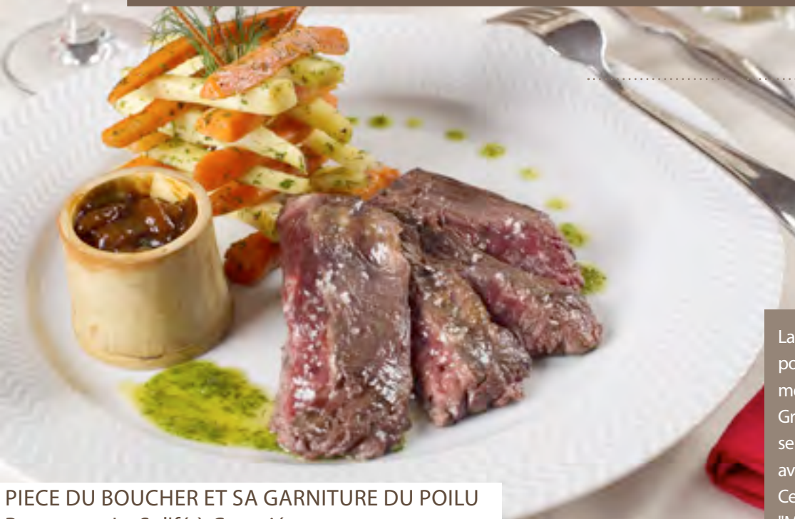
PIECE DU BOUCHER ET SA GARNITURE DU POILU Restaurant Le Sol'fé à Compiègne