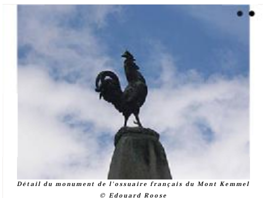
Détail du monument de l'ossuaire français du Mont Kemmel

Au printemps 1918, l'Etat-major allemand lance la « Kaiserschlacht », la bataille de l'Empereur, jouant son va-tout sur le front ouest. Il lance successivement deux vastes assauts dans la Somme et en Flandre. Déclenchée le 21 mars, l'opération « Michael », après avoir bousculé les troupes britanniques et menacé Amiens, s'essouffle et finit par se briser devant la résistance adverse - notamment australienne à Hébuterne.