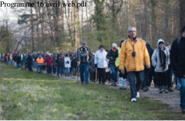
Des marcheurs en 2011