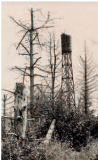
Observatoires dans le secteur du Chemin des Dames.