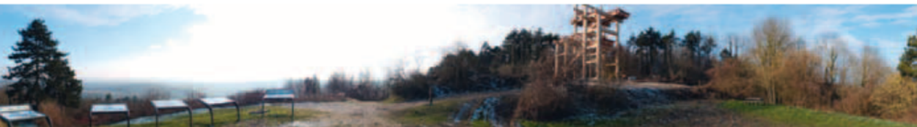
Vue depuis le haut de la tour-observatoire, janvier 2013.