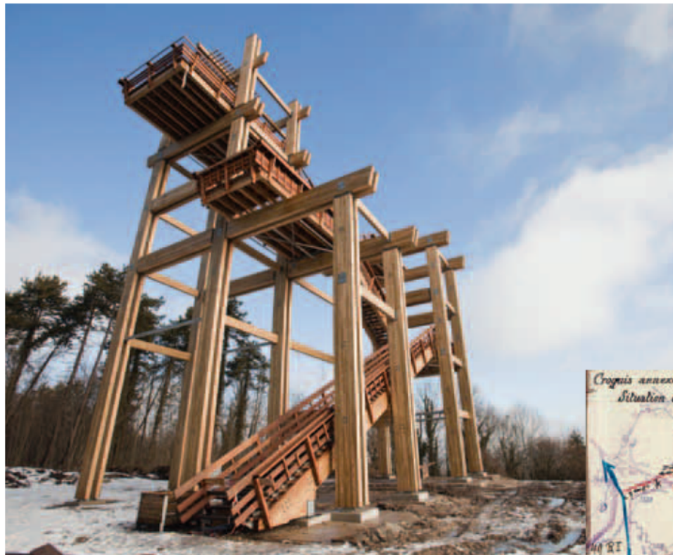
La tour-observatoire du Chemin des Dames en construction, janvier 2013.

Lors de cette édition sera officiellement inaugurée la tour-observatoire du Chemin des Dames sur le plateau de Californie.