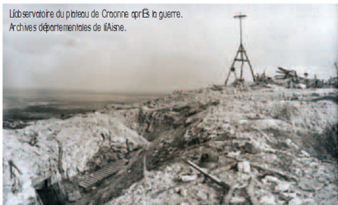
L'observatoire du plateau de Craonne après la guerre.

Conserver les observatoires que nous étions parvenus à enlever au bord de la falaise entre la ferme du Panthéon et la cheminée d'aération du canal, entre Cerny et le poteau d'Ailles, et sur le petit éperon d'Heurtebise ; réduire les trois poches allemandes, la ferme Froidmont, aux Vauxmerons et la sucrerie de Cerny qui assuraient elles-mêmes des observatoires à l'ennemi ; nous maintenir sur les plateaux de Vauclerc, des Casemates et de Californie. Le tracé des lignes nous assurait des vues et nous permettait presque partout un échelonnement de notre résistance en profondeur. Mais il présentait des sinuosités défavorables : une étroitesse qui ne laissait aucun recul, un horizon bouché par la crête que l'ennemi avait conservée et dont il nous regardait. Les Allemands se proposaient naturellement de nous arracher nos observatoires, de nous repousser vers les ravins à la tête desquels ils se réinstalleraient eux-mêmes pour mieux voir, de nous rejeter des trois plateaux entre Heurtebise et Craonne. Ainsi se déterminaient quelques points de friction autour desquels s'entreteint tout lié la bataille du Chemin des Dames. [C]