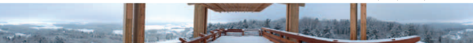
Vues panoramiques réalisées pendant les travaux.

Paysages et milieux. Située dans un environnement naturel privilégié dominant la forêt, la tour-observatoire permettra d'évoquer, en partant de sa reconstitution dans l'après-guerre, le paysage, sa richesse, mais aussi la fragilité des milieux dans leurs interactions avec les activités humaines.