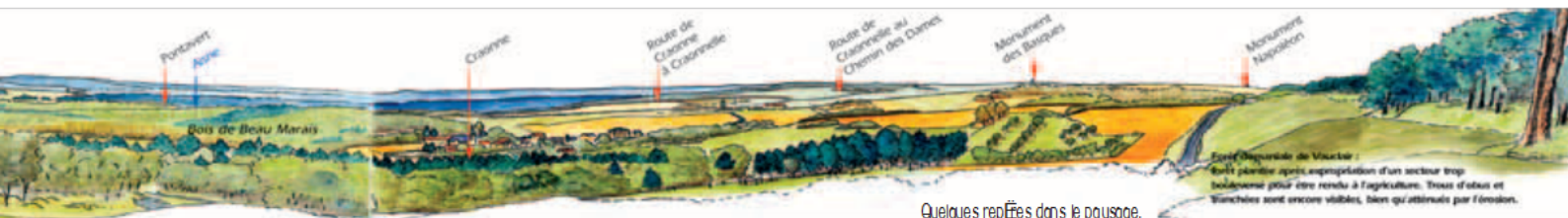
Quelques repères dans le paysage.