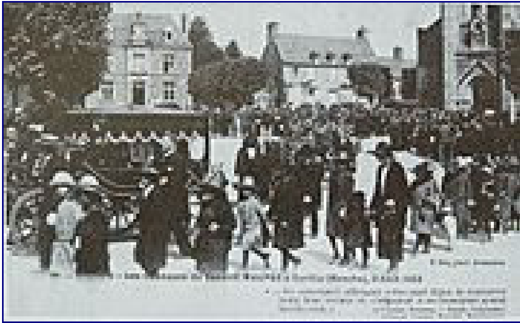
Obsèques de Théophile Maupas, le 9 août 1923, à Sartilly.

Un monument représentant quatre soldats, les yeux bandés, et ayant pour témoin le symbole de la Justice ployée à leurs pieds, est inauguré le 20 septembre 1925 à Sartilly, non loin du Mont Saint-Michel.