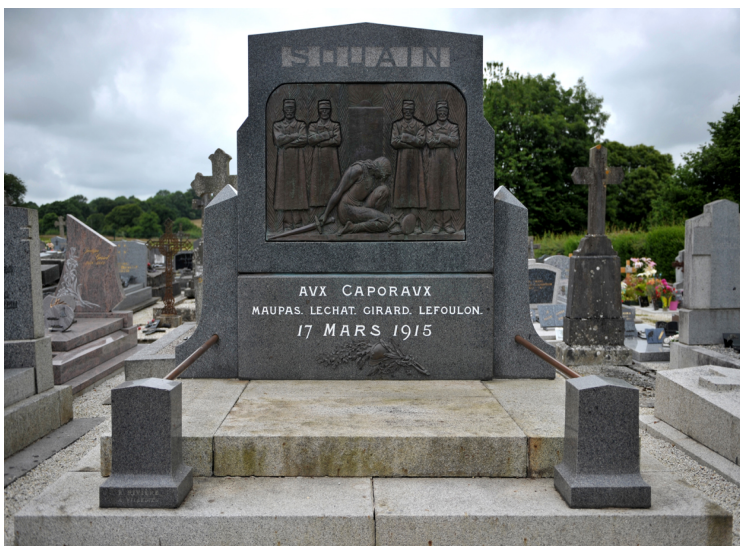
Monument dédié aux 4 fusillés ; à Théophile Maupas en particulier

L'œuvre en bronze a pour auteur le sculpteur Paul Moreau-Vauthier.