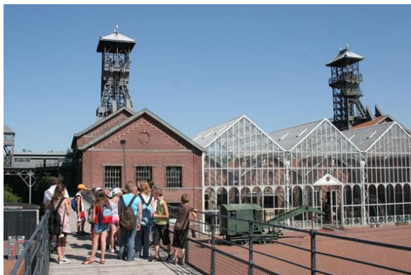
Vue du site depuis la passerelle

Situé à Lewarde, à 8 km à l'est de Douai dans le Nord, le Centre Historique Minier se trouve au cœur du bassin minier. Il est installé sur le carreau de l'ancienne fosse Delloye qui regroupe 8 000 m 2 de bâtiments industriels et de superstructures, sur un site de 8 hectares. Il est classé Monument Historique depuis 2009 et constitue l'un des sites remarquables du bassin minier inscrit au patrimoine mondial de l'Unesco en 2012.