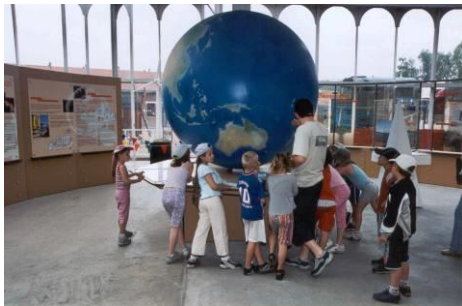
Globe des énergies

Pour mieux comprendre les problématiques et les enjeux liés à l'énergie ainsi que la place du charbon dans ces questions, découvrez l'exposition Energies : hier, aujourd'hui, et demain ? S'inscrivant pleinement dans les missions du centre de culture scientifique, cette exposition évoque la recherche énergétique pour répondre à une demande croissante de la population avec une consommation inégalement répartie dans le monde, la préservation de l'environnement et la lutte contre l'effet de serre,