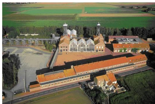
Vue aérienne du Centre Historique Minier

Créée en juillet 1982, l'Association du Centre Historique Minier est composée de trois structures complémentaires : un musée de la mine, un centre d'archives et de ressources documentaires et un centre de culture scientifique de l'énergie (CCSE). Le site, qui ouvre deux ans plus tard en 1984, accueille 17 594 visiteurs cette année-là.