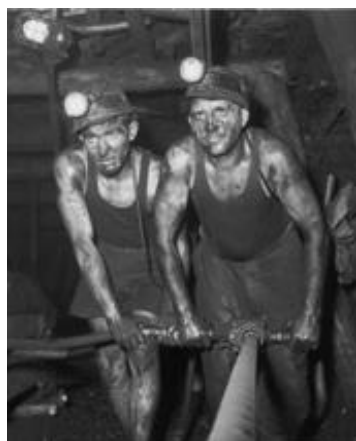
Foreurs, années 1950

L'année 2008 est axée sur la transformation des paysages dans le bassin minier du Nord-Pas de Calais, avec l'exposition Pays vert/Pays noir, empreintes de l'industrie minière dans le Nord/Pas de Calais .