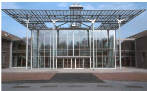
Bâtiment d'accueil

En 1994, le Centre accueille son millionième visiteur . Les activités continuent à se développer avec le lancement d'une collection d'ouvrages consacrés à la mine sous le nom Mémoires de Gaillette dont le premier en 1995 s'intitule Du coron à la cité, un siècle d'habitat minier dans le Nord/Pas-de-Calais, 1850 – 1950 . C'est le début d'une politique éditoriale. En 1997 , ce sont des rencontres patoisantes qui sont proposées pour la première fois, QuoQuiDi ; elles deviennent bisannuelles.