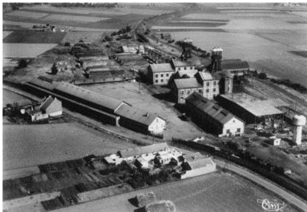
Vue aérienne de la fosse Delloye, vers 1950-60

La fosse Delloye, de l'ancienne Compagnie des Mines d'Aniche, a commencé son activité en 1931. Cette année-là ont été extraites 18 634 tonnes de charbon. Le record de tonnage a été atteint en 1963, avec 1 218 tonnes extraites par jour. Difficile à exploiter, le gisement devient peu rentable et l'exploitation s'arrête en 1971.