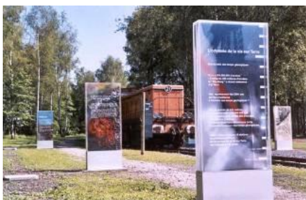
Echelle des temps

A quoi sert le parc à bois ? le réseau ferré ? Qu'est-ce que la passerelle de mise à stock ? A travers le site, les bornes de l'exposition Histoire de la fosse Delloye expliquent la physionomie du carreau des années 1930 aux années 1950.