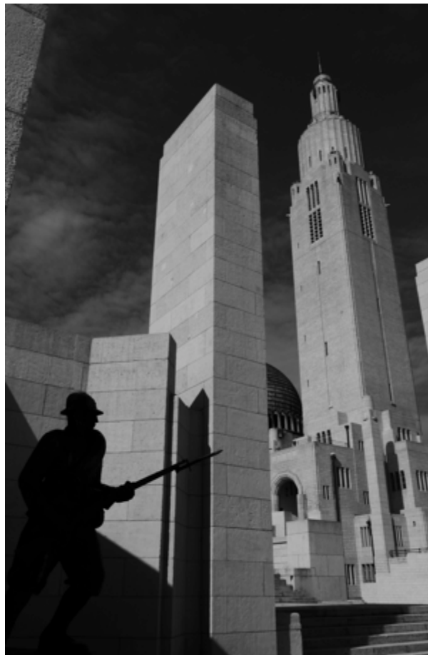
Monument Interallié à Coixie

Les historiens de la «Grande Guerre » parlent de ce conflit comme étant inaugural en termes de violences. La Belgique a connu beaucoup d'atrocités pendant ces quatre années. Les massacres de plus de 5000 civils en août 1914, la destruction de plusieurs villes, les pratiques de violences, sur les champs de bataille comme ailleurs, l'exode de population, les rigueurs de l'occupation militaire, la déportation, la répression, ont dépassé toutes les limites, et ce dès 1914 jusqu'à 1918.