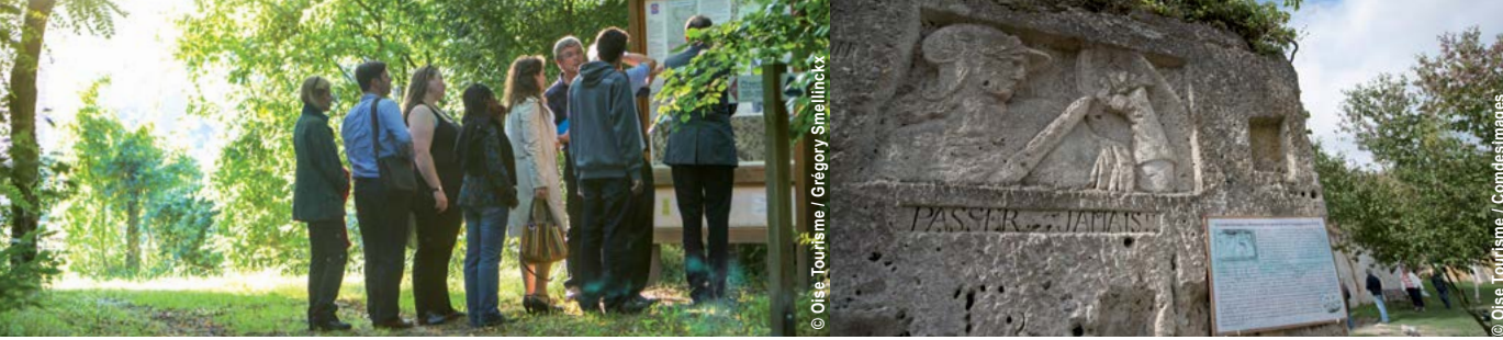
Tracy-le-Mont sur les sentiers de la Grande Guerre ▲