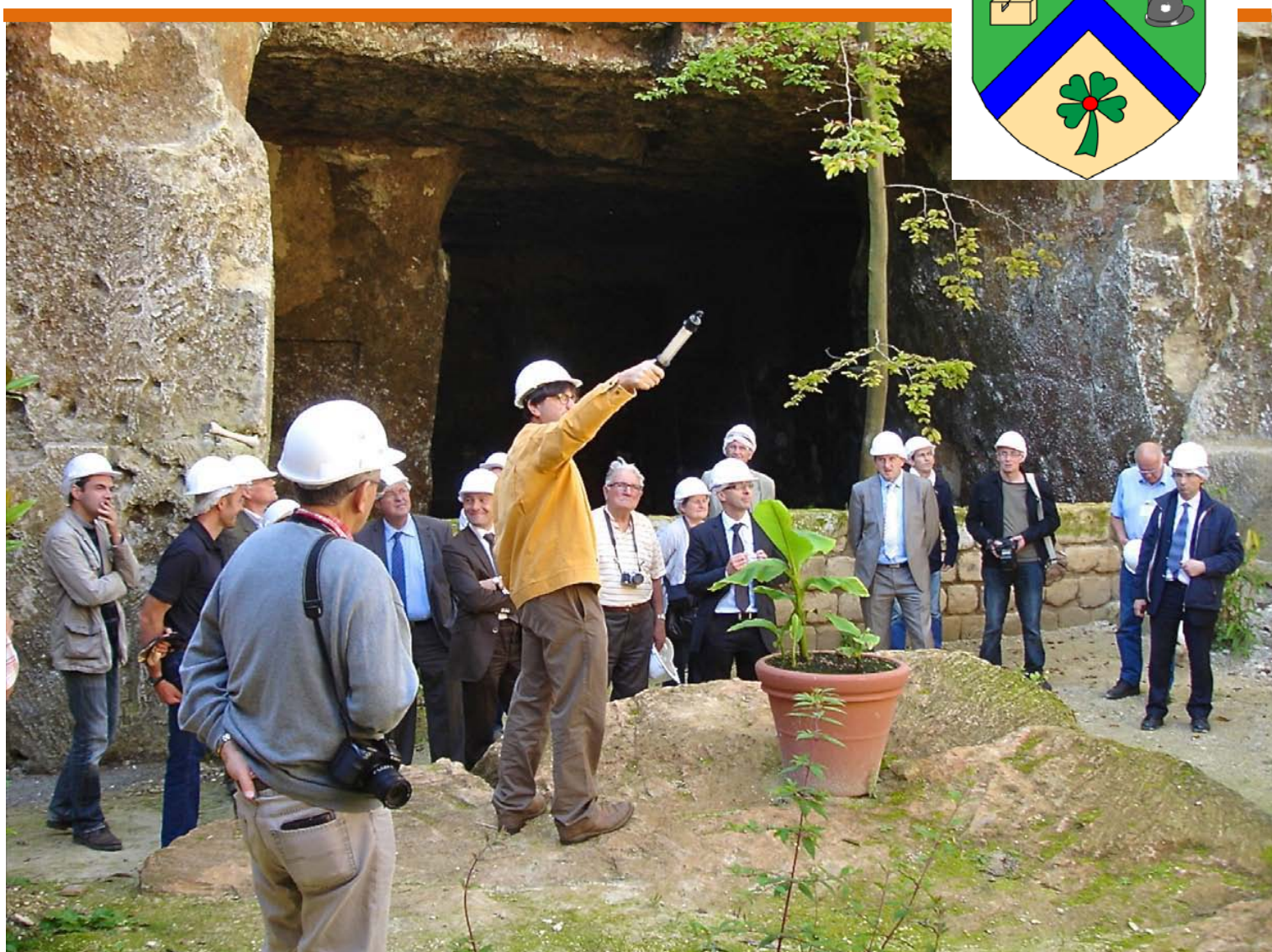
Visite de la commission départementale pour l'inscription du site des carrières de Montigny au patrimoine mondial de l'UNESCO dans le cadre des paysages et sites historiques de mémoire de la première guerre mondiale à préserver.

L'association existe depuis Mai 2008 et s'est donnée pour vocation de restaurer et d'animer le patrimoine communal.