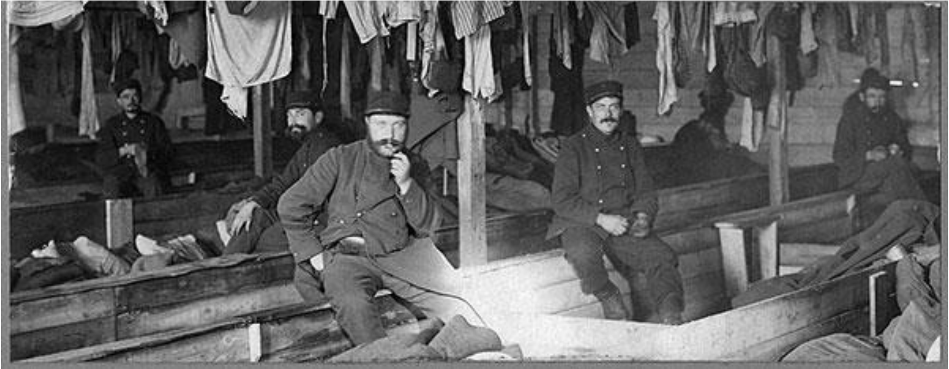
21 soldats étampois ont été internés au KGL de Münster [Westphalie], entre l'automne 1914 et l'hiver 1918 ( Collec. partic. ).