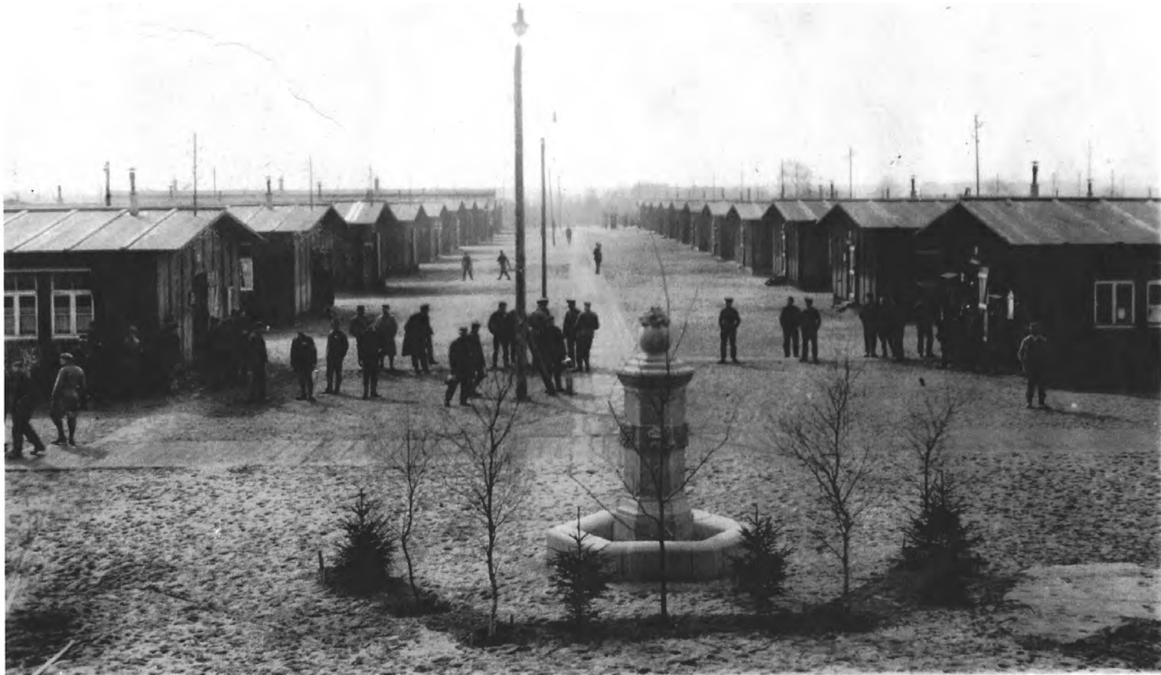
Le KGL de Dülmen [Westphalie] en 1915